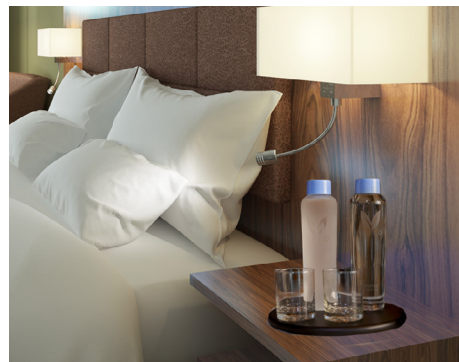
Service d'eau de consommation en chambre

Un système d'eau filtrée Quench peut remplacer l'utilisation de bouteilles de plastique jetables à travers toute votre propriété.