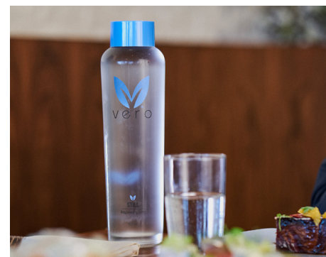
Service de repas, bar & restaurant