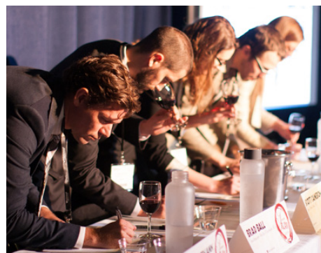
Centres événementiels et de conférences